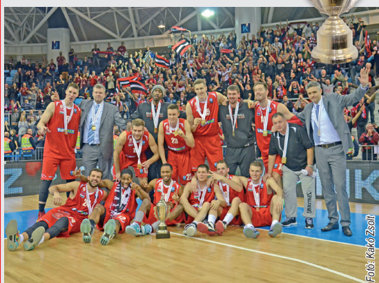
Hatodik alkalommal nyerte el a trófeát a szolnoki csapat